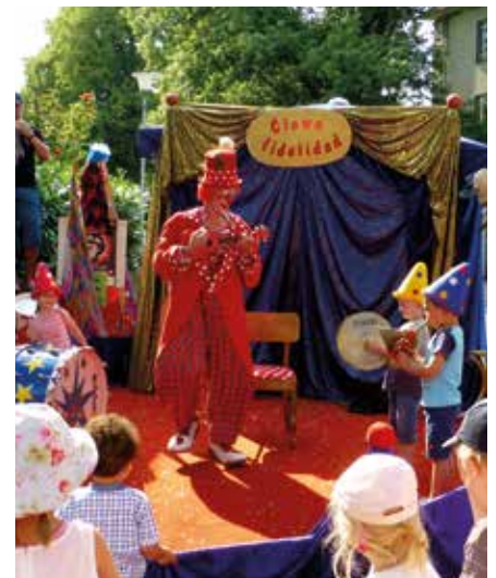
Der Clown Fidelidad – Spaß für Jung und Alt – wird auch dieses Jahr wieder mit von der Partie sein.

chen. Die offizielle Eröffnung des Festes erfolgt mit Fassanstich am 01.08. um 14.30 Uhr auf der Hauptbühne am St. Josefs-Kirchplatz. Die Stände sind indes schon ab 11 Uhr geöffnet. Die Aktions- und Werbegemeinschaft der Hammer Straße freut sich bereits jetzt, mit den zahlreichen Besuchern aus nah und fern das 29. Straßenfest zu feiern – alle sind herzlich eingeladen!